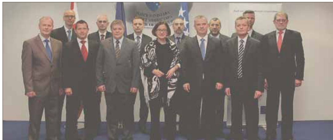
Das Projekt ist ein Höhepunkt grenzüberschreitender Zusammenarbeit zwischen Bosnien-Herzegowina und Österreich. Es ist wieder ein Kapitel der langen Kooperation und Freundschaft zwischen den Ländern geschrieben worden, stellte die BMI Mag. a Mikl-Leitner fest. Im Bild mit den Konferenzteilnehmern in Sarajewo.

Er ist künftig strategische Grundlage Bosniens zur Bekämpfung von Geldwäsche, Drogenhandel oder Terroris- musfinanzierung.