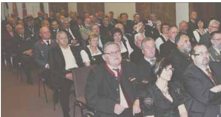
Aufgrund der Unterstützung von Ehrenmitglied Landeshauptmann Dr. Josef Pühringer war die Durchführung der Präsentation im historisch bedeutungsvollen Steinernen Saal des öö. Landhauses möglich. Das Interesse zur Teilnahme war sofort sehr groß. Um nicht über das Fassungsvermögen von 300 Personen hinauszukommen, musste sogar die Teilnehmerzahl aus den Ortsgruppen beschränkt werden, damit der Platz ausreichte.