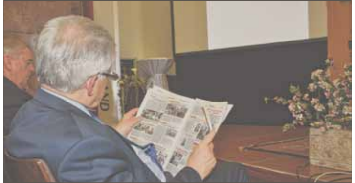
Auch Ehrenmitglied Landeshauptmann Dr. Josef Pühringer gehört zu den Zeitungsbeziehern der OÖKB-Nachrichten und wirft gerne einen Blick auf die Berichte aus dem Verein, wie man auch vor Beginn der Leitbildpräsentation im Steinernen Saal im Linzer Landhaus beobachten konnte. Der OÖKB dankt LH Dr. Pühringer für sein Interesse und seine Unterstützung.