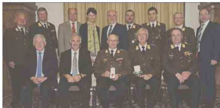
Der OÖKB gratuliert den verdienten Feuerwehrkameraden, welche im Steinernen Saal des oö. Landhauses mit den Ehrenzeichen in Silber oder dem Verdienstzeichen in Gold und Silber des Landes Oberösterreich ausgezeichnet wurden.

Mit anderer Bezeichnung wird es bis heute unverändert verliehen. Seit 1989 zielt es die höchste militärische Auszeichnung der Republik als Militärverdienstzeichen. Auch das ÖBH-Wehrdienstzeichen schmückt das Leopoldkruz bis heute.