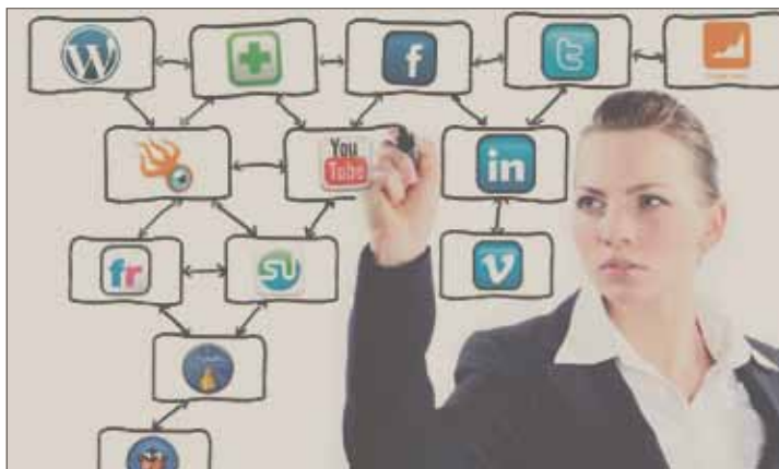
Virtuelle Medienwelt: für die nach 1980 Geborenen so real wie virtuelle Freunde