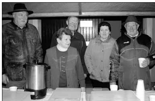
Der Vorstand dankt allen Helfern und den Uttendorfern, die hervorragende Gäste waren.

hat sich gelohnt, denn die vorbereiteten Köstlichkeiten wurden von den Gästen sehr gut angenommen.