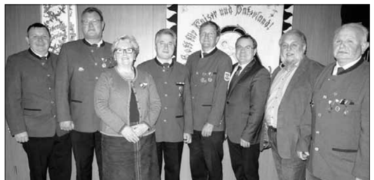
Der neue Vorstand mit Fahnenpatin, Bürgermeister und Vizepräsidenten