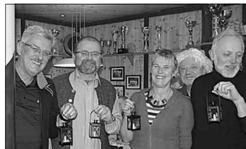
Die „Rote Laterne“ für den letzten Platz ging humorvollerweise an die „schwarzen Ortspolitiker“.