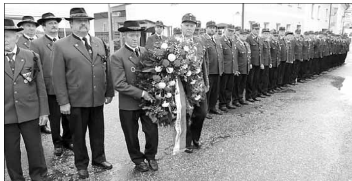
Kranzniederlegung durch Kameraden des ÖÖKB und der Feuerwehr

und der hl. Messe ist ein Kranz am Kriegerdenkmal feierlich niedergelegt worden. Wetterbedingt fand der Frühschoppen nicht im Freien statt. Trotzdem kann der erfreuliche Reinerlös wiederum einem guten Zweck zugeführt.