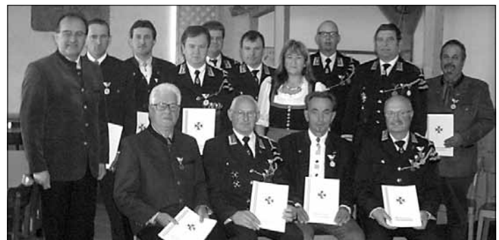
Die Geehrten mit Bürgermeister und Obmann

Mit 56 aktiven Kameraden ist die OG am 26. April zur Georgiausrückung angetreten und danach