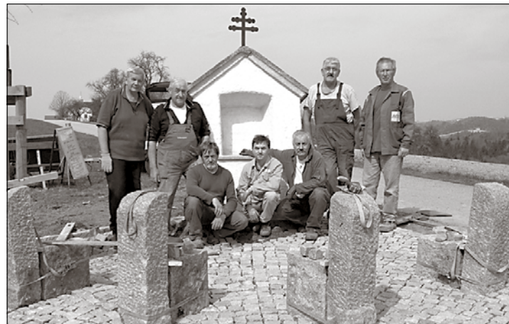
Die Kameraden vor ihrem gelungenen Werk