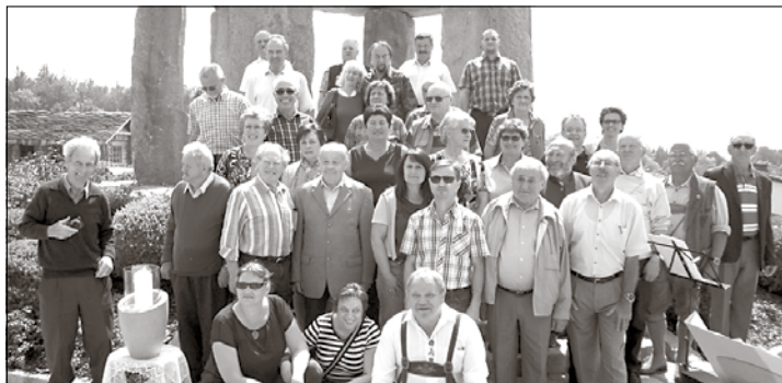
Die Teilnehmer nach dem Mittagessen im Landgasthof Feichthuber