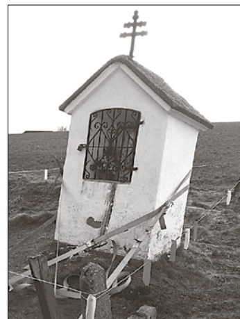
Die Kapelle vor der dringenden Sanierung