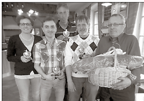
Die erfolgreiche Mannschaft mit Pokal war ein „untypischer Staffelfverband“.