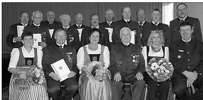
Ehrenobmann mit den Geehrten und Ehregästen