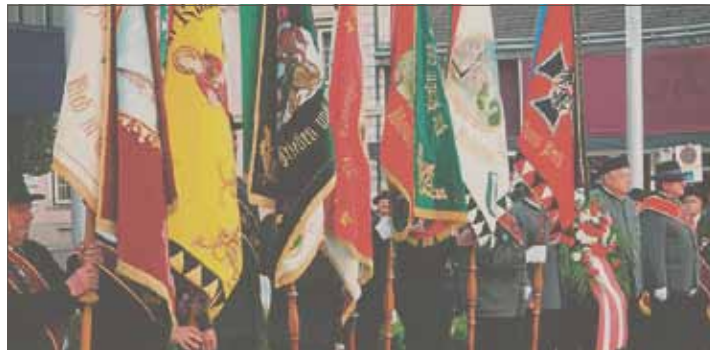
Wie hier in Perg haben die OÖKB-Ortsverbände im ganzen Land würdige Gedenkfeiern für 70 Jahre Frieden und 60 Jahre Freiheit abgehalten.