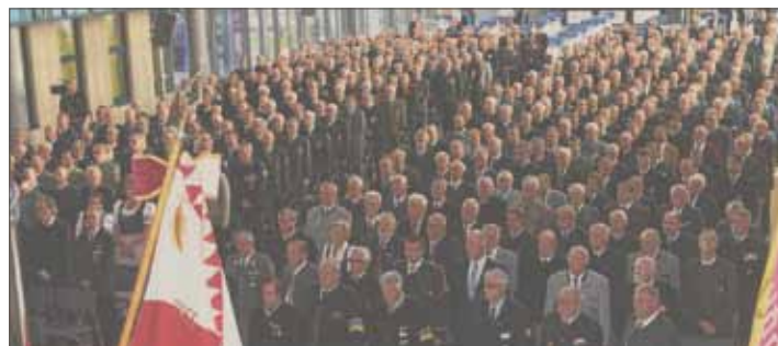
Der Delegiertentag war ein Signal des Interesses an den Werten des ÖÖKB und ein beeindruckender Auftritt.

Als solche und durch die Zahl seiner Mitglieder ist der ÖÖKB eine gesellschaftspolitisch ernst zu nehmende Kraft. Dadurch ist der Landesvorstand mehr als legitimiert, weiterhin für die im ÖÖKB-Leitbild formulierten Werte und ihre Umsetzung in un-