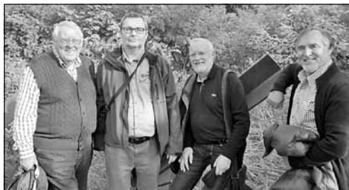
Die Kameraden des AR Wels waren vom Ausflug des Hessenbunds in die Panzertruppenschule in Zwölfaxing sowie das Bunkermuseum Ungerberg in Bruckneudorf am 25. Oktober begeistert.

Wels teilgenommen. Die Vielfalt der Uniformen erlebten die Kameraden beim Zehn-Jahre-Gründungsfest des Trauner Schützenkorps.