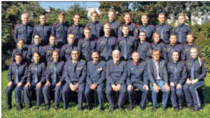
Die Lehrgangsteilnehmer des PGA 12/2016