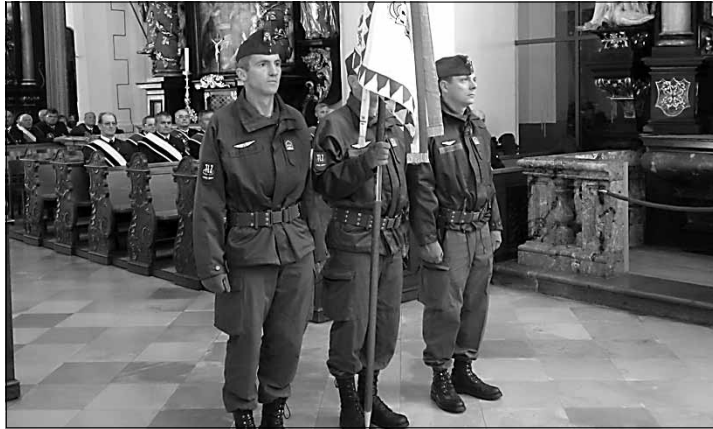
Die Standarte des Kommandos Luftraumüberwachung aus Salzburg in der bis zum letzten Platz gefüllten Wallfahrtsbasilika des hl. Michael

Veranstaltung. Die Pflege der Kameradschaft kam danach in den Gasthäusern von Mondsee nicht zu kurz. Die Ortsgruppen des Mondseelands danken allen Wallfahrern, Gästen und Ehrengästen für ihre Teilnahme und dieses Signal vorbildlicher Kameradschaft.