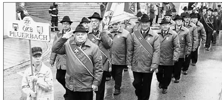
KB Peuerbach war nicht nur bei der Ausrückung zum 60-Jahre-Gründungsfest des Stadtverbands Grieskirchen stark vertreten.

Stadtverbands Grieskirchen sowie am 29. Oktober zur Fahnensegnung der OG Gallspach mit der Fahnenabordnung ausgerückt sind.