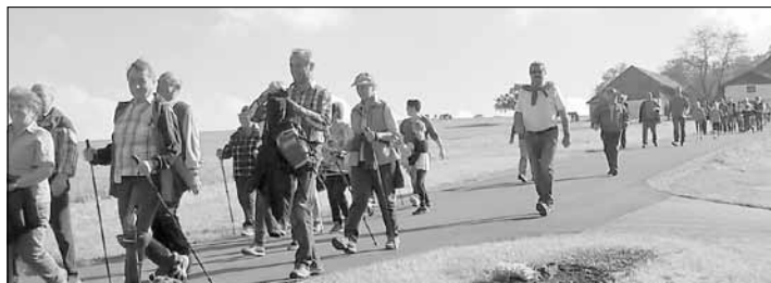
Der bestens organisierte Wandertag begeisterte über 100 Teilnehmer aller Altersklassen

sich auf die 8 km lange Route aufmachten. Am Ziel wartete beste Verpflegung in der Labstation des Obmanns, wo der Tag in kam. Runde sein gemütliches Ende fand.