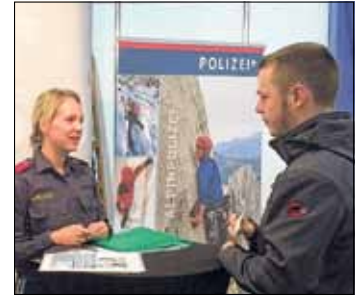
Mit sehr kompetentem und freundlichem Auftreten haben die Lehrgangsteilnehmer zahlreiche Besucher bei ihrer Berufswahl unterstützt.

konkrete Gespräche mit künftigen Bewerbern. Die Schüler der SiAK haben mit freundlichem und kompetentem Auftreten wieder viel zur positiven Darstellungen des Polizeiberufes beigetragen.