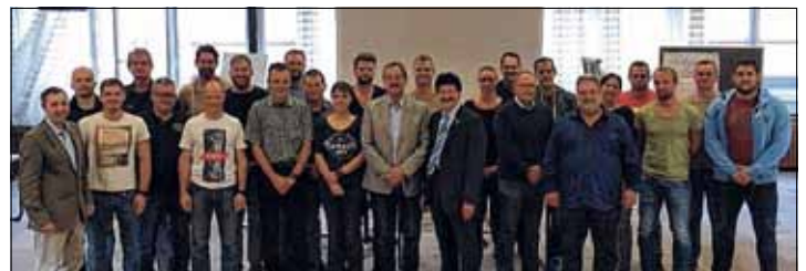
Der Sprecher des Lehrgangs dankte dem Leiter des BZS OÖ und den Vortragenden für die tolle Fachausbildung und ihr Engagement.

rechtliche Grundlagen. Mit der sehr lebensnahen Art der Wissensvermittlung, anhand praktischer Beispiele, haben die Vortragenden das Interesse aller Teilnehmer getroffen. Ein weiterer Gewinn war der persönliche Austausch der Absolventen untereinander. Dabei ist über Erfahrungen aus eigenen Fällen viel diskutiert worden. Auch das Angebot von Hilfestellungen durchs LKA weckte großes Interesse. Das BMI plant mit solchen Fachausbildung jährlich bis zu 300 Polizist(inn)en zu Spezialisten auszubilden, um die Aufklärungsquote von Straftaten weiter zu verbessern.