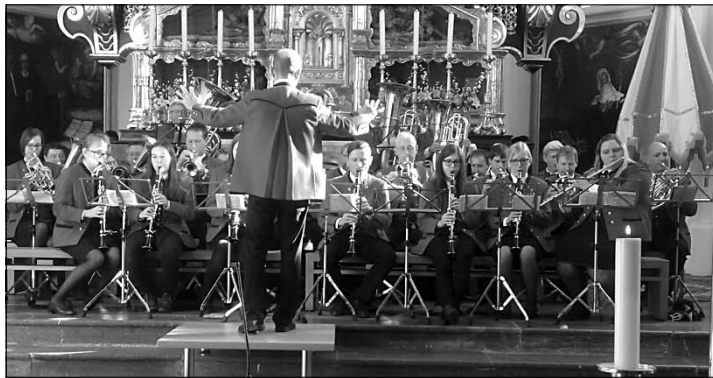
Musikalisch stimmungsvoll begleitet wurde die Wallfahrt von der Musikpelle Tiefgraben auch in der St. Michael Basilika.