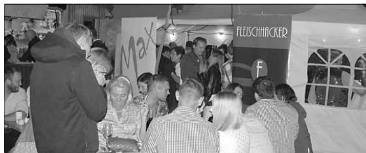
Der Ortsverband dankt allen Gästen sowie den fleißigen Helfern für den reibungslosen Ablauf und den tollen Erfolg.

Schießbude und Weinlaube sorgten die Kameraden für beste Unterhaltung bei den Besuchern.