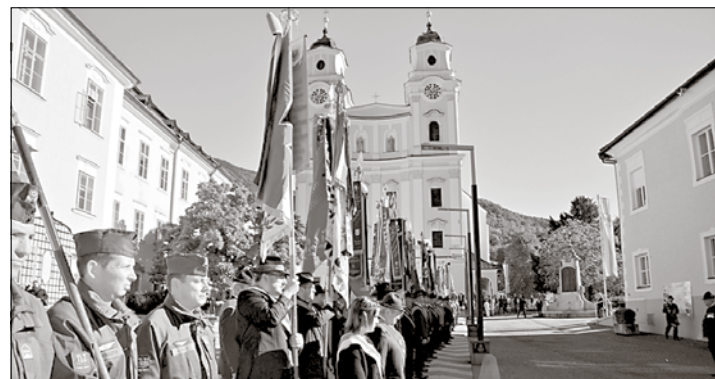
Der Festzug mit ca. 300 Wallfahrern vor der Basilika in Mondsee