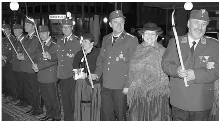
Mit Fackeln bildeten die Kameraden der FF Gallspach und Enzendorf mit der Goldhauben- und Hutträgerinnen Gruppe ein Spalier beim Defilee.