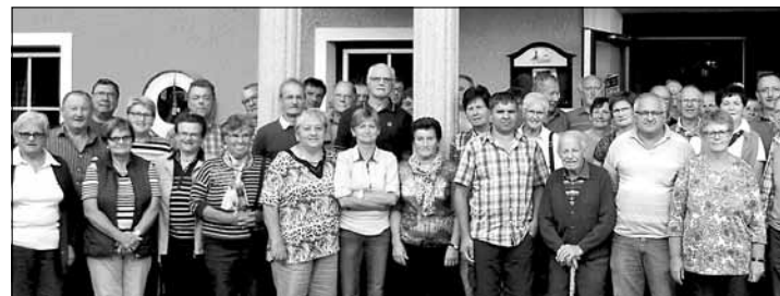
Mehr als fünfzig Teilnehmer waren vom Tagesausflug begeistert