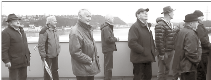
Wie die Ausflugsteilnehmer sehen konnten, ist der Ennshafen ein echtes Drehkreuz für den internationalen Warenumschatz.

Bei der traditionellen Abschlusseinkehr im Gh. Schicklberg sind nach einem Tag voller Neuigkeiten die Eindrücke im kam. Beisammensein gewürdigt worden.