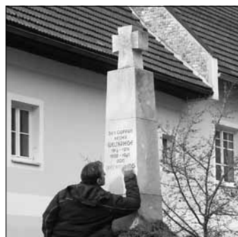
Auch die Inschriften und Namenszüge wurden perfekt wiederhergestellt.