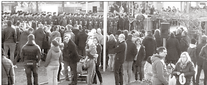
Die 153 Rekruten der 4. Panzergrenadierbrigade mit dem KB Rohr am überfüllten Ortsplatz in Rohr

ren, legten öffentlich ihr Treuegelöbnis ab. Zur Freude der Kameraden wurde die OG Rohr in die feierliche Gestaltung des Festaktes miteinbezogen. Es war der OG eine große Ehre und Freude, den Jungmännern zur Seite zu stehen.