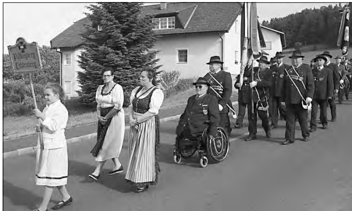
OG Lichtenberg-Pöstlingberg beim 50-jährigen Gründungsfest in Eidenberg

der gemütliche Frühschoppen zeichneten diese Veranstaltung aus. Herzliche Gratulation der OG Eidenberg.