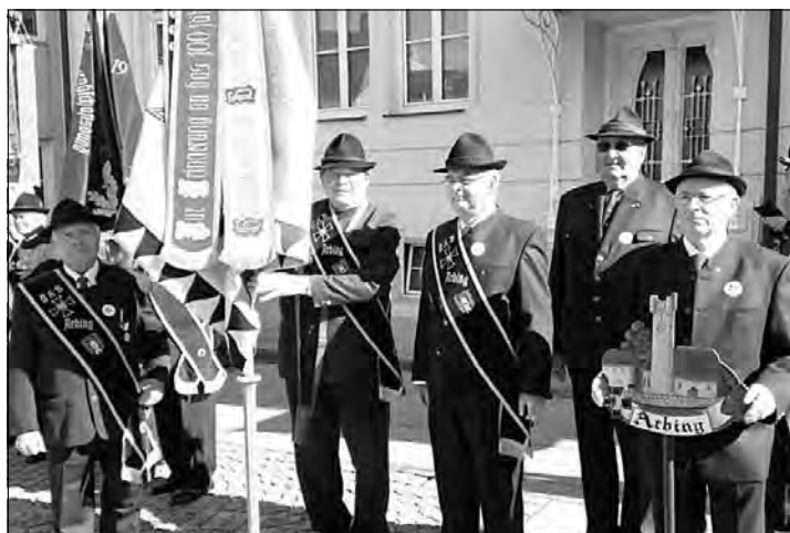
Beim Gründungsfest in Gallneukirchen war die OG Arbing mit einer ansehnlichen Abordnung vertreten, dafür dankt der Vorstand den Teilnehmern herzlich.