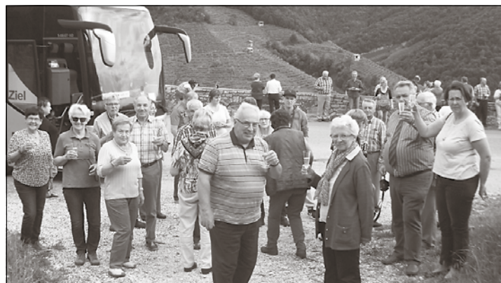
Prost! – in den Prosecco-Weinhügeln bei Valdobbiadene

Nachmittags folgte die Besichtigung der Festungsstadt Montagnana, die von einer 2 km langen Stadtmauer umgeben ist! Als kam. Abschluss stand eine Vulkanweinkostung am Programm. Am dritten Tag ging es per Schiff in 90 Min. direkt auf den Markusplatz, in die von Tausenden Touristen überquellende Stadt Vene-