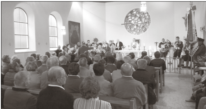
Es kamen so viele Besucher, dass sie sogar vor der Kirche Platz nehmen mussten. Durch die Pflege der OG glänzte die Kirche heuer besonders.