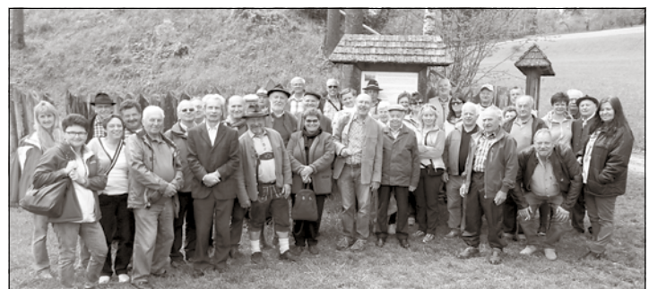
Das Gruppenfoto bei den Kanonen auf der ehemaligen Schwedenschanze in Rading.

im eigenen Bezirk begrüßen. Nach einer Kaffeepause, der Wanderung am Märchenwanderweg mit Labestation (gespendet von