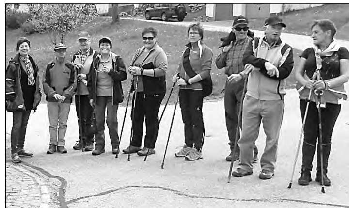
Wanderer bei einer Station des Gugerweges mit dem besonders herrlichen Ausblick über Julbach. Alle Teilnehmer haben diesen Wandertag genossen.

Der Regen hat sich bis zur Einkehr zurückgehalten und so kamen alle trocken an.