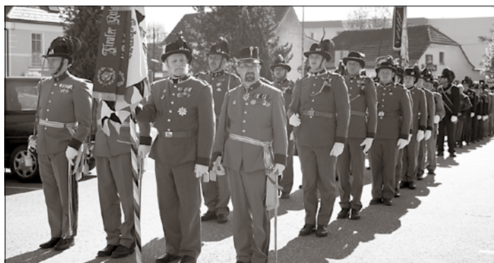
Eine ganz besondere Freude und Ehre war die Teilnahme der Tiroler Kaiserjäger aus Schwaz. Ihr Salutschießen beeindruckte die Gäste.