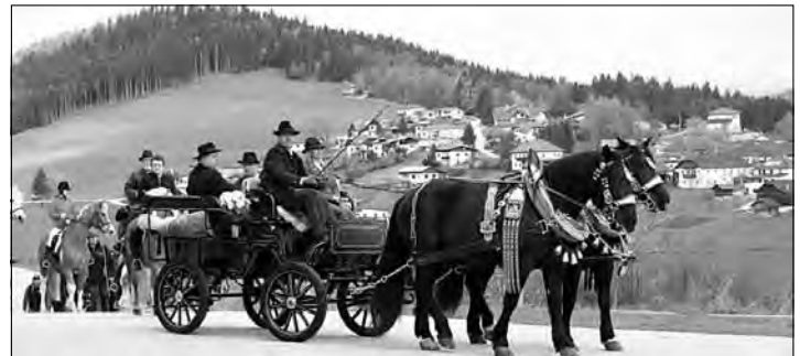
Ein prächtiges Gespann führte den Georgiritt an.