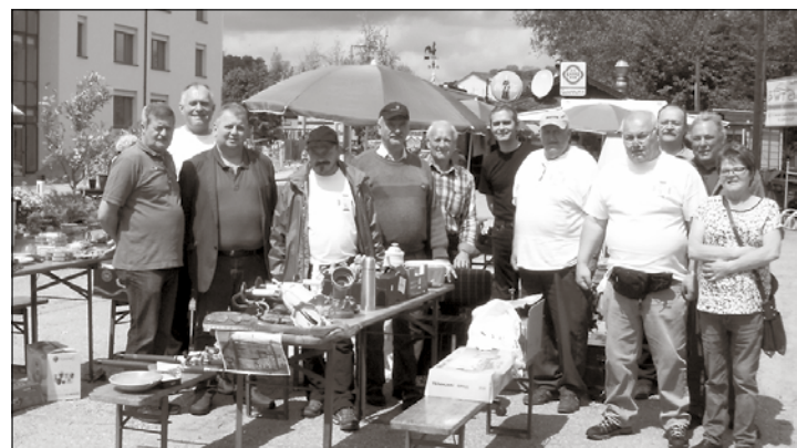
Die erfolgreiche Flohmarkt-Mannschaft der OG St. Georgen/Gusen