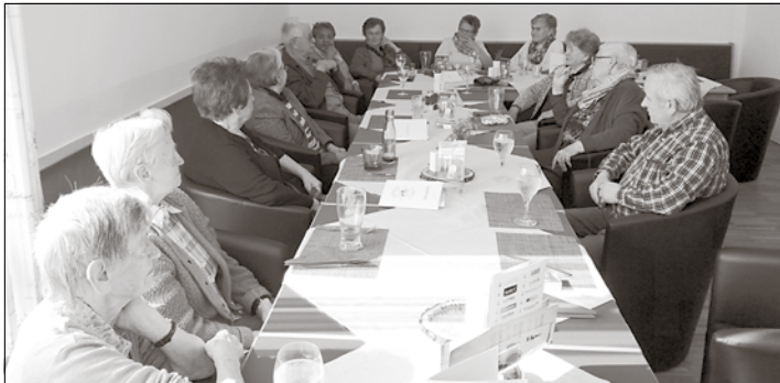
Die Damen haben den kam. Nachmittag sichtlich genossen und erfreuten sich an manch nettem Gespräch.