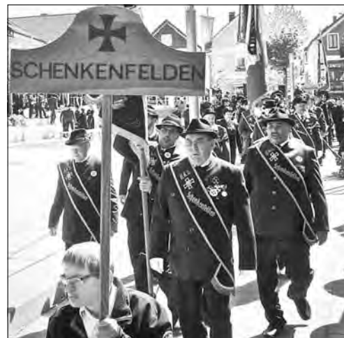
Die Kameraden aus Schenkenfelden sind zu zwei Gründungsfesten ausgerückt. Beide waren toll organisiert und ein schönes Erlebnis für alle Teilnehmer.

ist bleibender Effekt dieses guten Vereinsjahres. Zu danken gilt es allen Mitgliedern, die sich für Ausrückungen Zeit genommen haben. Besonders zu den letzten bei den Gründungsfesten in Eidenberg und Gallneukirchen.