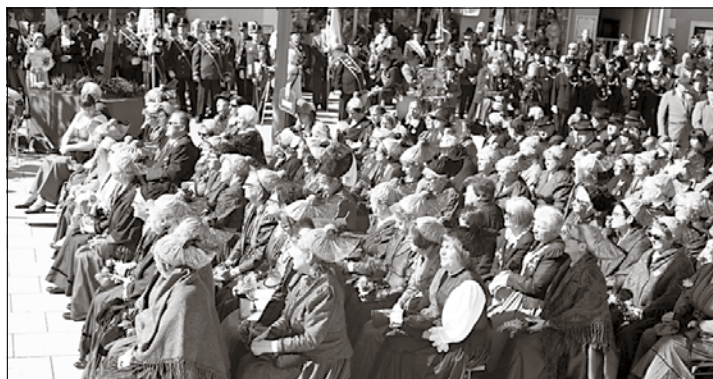
Um die hundert Goldhaubenfrauen, Kopftuch- und Hutträgerinnen gaben dem Fest einen besonderen Glanz.

Foto auf der OÖKB Homepage www.oockb.at mit Link zum TV-Bericht vom Team Buntes Fernsehen Engerwitzdorf.