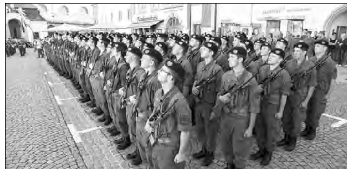
Den 100 Rekruten des Panzerstabsbataillon 4 soll die Zeit beim ÖBH eine Bereicherung mit wertvollen Erfahrungen fürs Leben sein, wünschte ihnen Landtagsabgeordnete Lackner-Strauss als Vertreterin des Landeshauptmanns Mag. Thomas Stelzer.

Bundesheer in der Region. Sie anerkennen die Leistungen der Soldat(inn)en für die Sicherheit und das Wohlergehen der Menschen im Land.