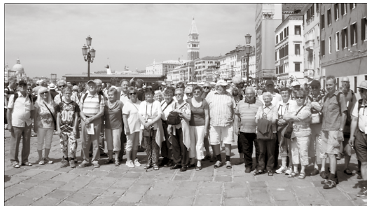
Nach der Ankunft per Schiff vor San Marco in Venedig waren die Reisenden von den Touristenmassen überrascht!

Am nächsten Tag setzte sich die Reise, vorbei am Wallfahrts-Städtchen Monselice, der Burgenstadt Este, Abano Terme, dem Kloster Praglia und dem Bergstädtchen Teolo, durch die einsam-romantischen Euganeischen Hügel südwestlich von Padua fort.