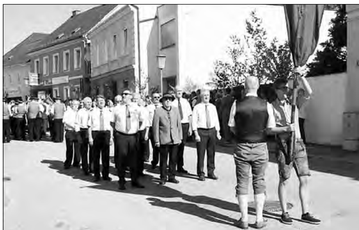
Es ist eine Freude, wenn der Stadtverband in starker Zahl ausrückt, so wie in Gallneukirchen oder bei der Fronleichnamprozession. Danke, Kameraden! Der Vorstand dankt allen die sich dafür Zeit nehmen.