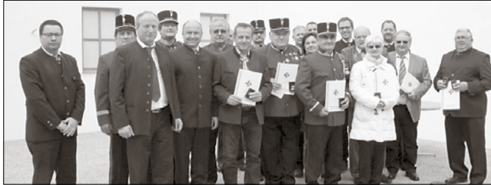
Ehrengäste mit einem Teil der Geehrten und Ausgezeichneten

Mit dem Dank und dem Ersuchen um gute Zusammenarbeit schloss der Obmann die JHV.