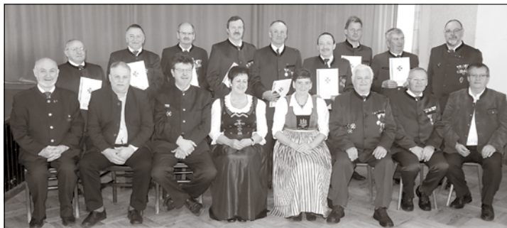
Die für Treue und Verdienste geehrten Kameraden mit Ehrengästen der JHV

Der Ehrung folgte zuletzt die Verlosung eines Gutscheines für den Herbstausflug 2017.