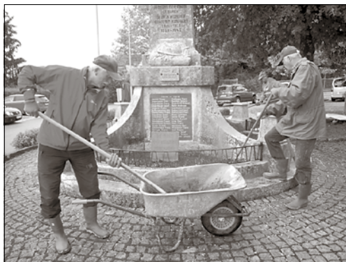
Die fleißigen Kameraden bei der Arbeit

Blumenbeete neu gestalten, einfach das volle Programm war gefordert. Die OG hat alles mit fünfundfünfzig eigenen Arbeitsstunden bei mehreren Arbeitsinsätzen mit zehn Kameraden erledigt. Nur die Erneuerung der goldenen Schrift auf den Namenstafeln mussten Spezialisten erledigen. Damit ist dieses Denkmal für Bürger aus St. Ulrich mit Unterstützung ihrer Gemeinde und der OG wieder ein Blickfang und eine würdige Erinnerungsstätte.