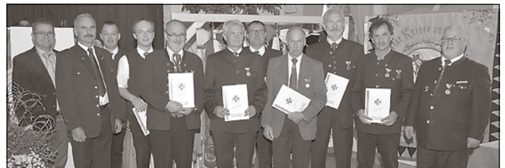
Ehrengäste und geehrte und ausgezeichnete Kameraden im Festsaal Gh. Ziegelböck