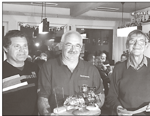
Gratulation an die Fornacher Schützen und ein großes Danke allen Teilnehmern fürs faire Turnier!

markt. Der Sieg konnte zum 4. Mal in Folge gefeiert werden. Somit ging der Wanderpokal zum dritten Mal bereits nach Fornach.