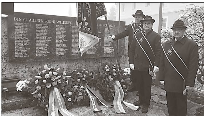
Der November ist alljährlich die Zeit der ÖÖKB-Gedenken und Zeit, dankbar für Frieden und Freiheit zu sein.