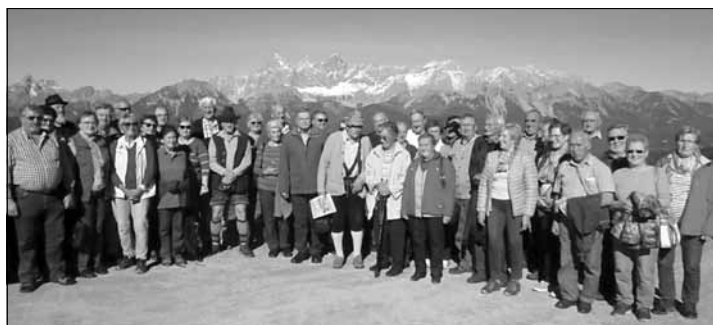
Die Teilnehmer des Bezirksausflugs vor der herrlichen Alpenkulisse

Die Heimreise führte die begeisterten Kamerad(inn)en durchs Lammertal heim in den Bezirk.