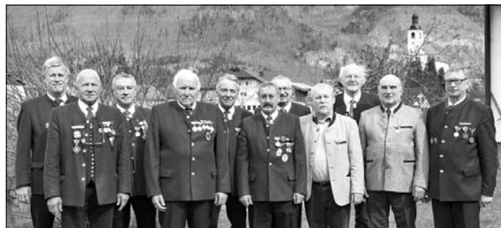
Der neue Vorstand der OG Grünau mit den geehrten Kameraden bei der Jahreshauptversammlung