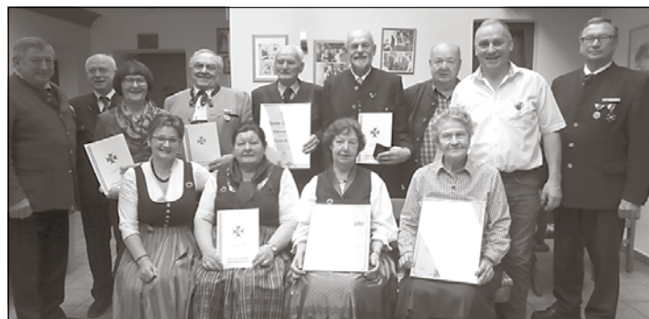
Die für gelebte Kameradschaft, Treue und ihre Unterstützung geehrten Kameradinnen und Kameraden

für vorbildliche Kameradinnen und Kameraden. In den Ansprachen wurde immer wieder hervorgehoben, wie wichtig Kameradschaft heute sei. Obm. Drack bedankte sich bei allen Anwesenden für ihr Kommen sowie für die gelebte Kameradschaft und den guten Zusammenhalt.