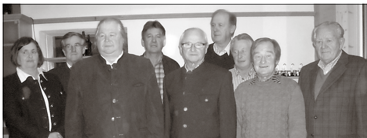
Die Jubilare mit den Kameraden der OG Pettenbach bei der Feier

cher Gutscheine, einen Blumenstrauß und beste Glückwünsche überbrachten. Danke schön für die netten Stunden.