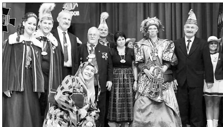
Mehr Fotos vom Ball sind auf der Homepage der Faschingsgilde Vorchdorf ( www.voridori.at ) zu sehen.