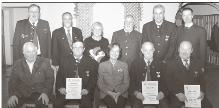
Die Geehrten mit den Ehrengästen der Jahreshauptversammlung 2015