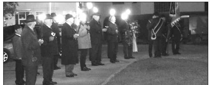
Kameraden beim feierlichen Totengedenken am Kriegerdenkmal