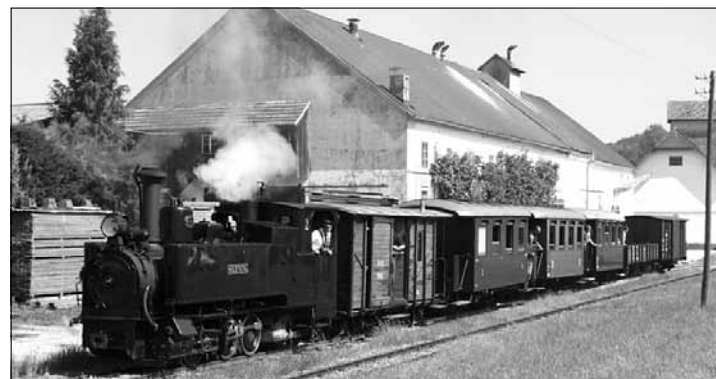
In ihrer Blütezeit war sie von großer wirtschaftlicher Bedeutung und auch für den Personenverkehr zwischen Garsten, Steyr und Klaus unverzichtbar.

Beherten Bahnliebhabern, allen voran dem Vater des Vortragenden, ist es mit erheblichen Schwierigkeiten gelungen, den Streckenteil zwischen Steyr und Grünburg als Museumsbahn einzurichten und zu betreiben. Sie ist heute weder aus dem Landschaftsbild noch aus dem touristischen Angebot wegzudenken. Eine Fahrt mit ihr ist ein Familienerebnis und weckt bei der älteren Generation viele Erinnerungen.