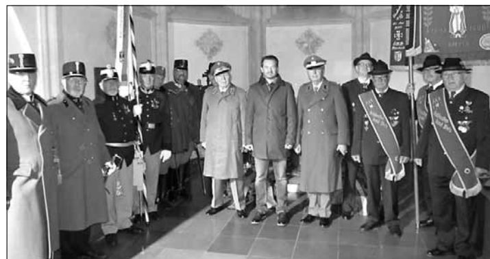
Fahnenzug bei der Gedenkfeier in der Sigmarmarkapelle in Wels