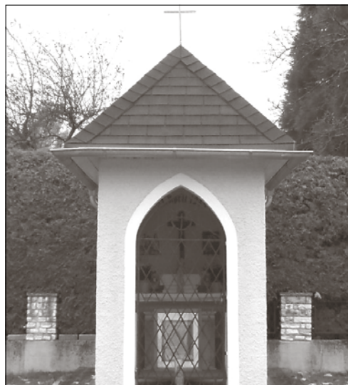
Die Kameraden danken der Stadtgemeinde Attnang für die Restauration des Daches der Kapelle für 21. April 1945.