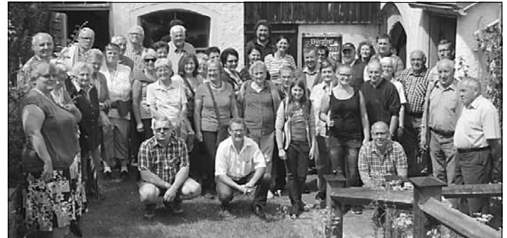
Für den schönen Tag dankt die Ortsgruppe allen Teilnehmern und den Organisatoren herzlich.

Die Heimreise über Mauerkirchen und Maria Schmolll endete mit dem Ausklang beim Wirt z'Gries in Pram.