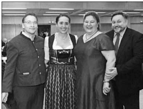
Die Ballnacht bot wieder beste Unterhaltung und tolle Stimmung