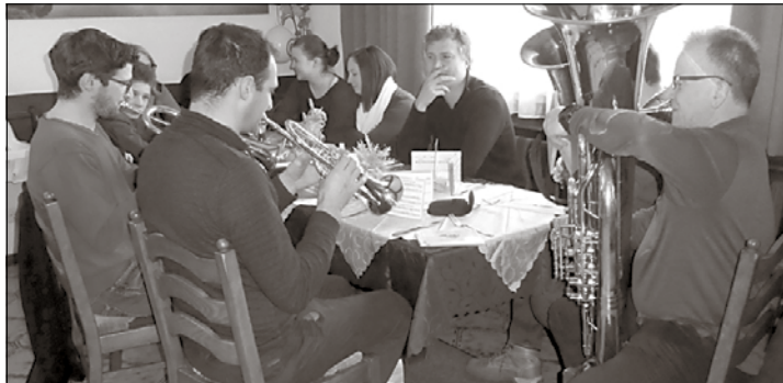
Die Hubertusmusikkapelle bei der stimmungsvollen Weihnachtsfeier im Gh. zum Italiener